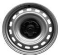
Copricerchi da 15" e 16 DEMI-STYLE