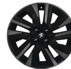
18-Zoll-Alufelgen EVISSA, glanzgedreht