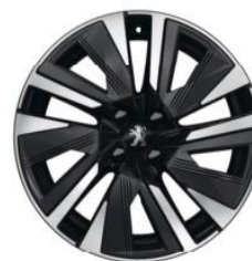
18-Zoll-Alufelgen NOLITA, glanzgedreht