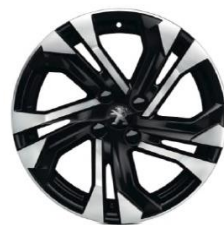
17-Zoll-Alufelgen SALAMANCA, glanzgedreht