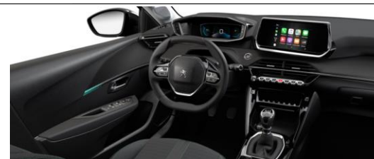
Stoff COZY Kunstleder