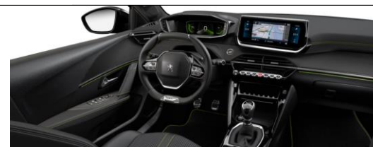
Stoff CAPY Kunstleder