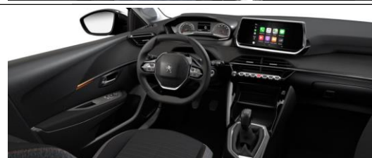
Stoff Pneuma 3D