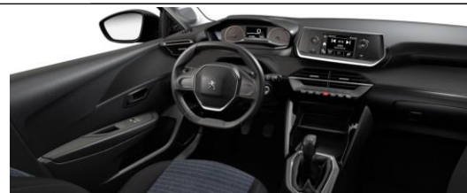
Stoff Para Blau