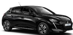
Schwarz Perla Nera